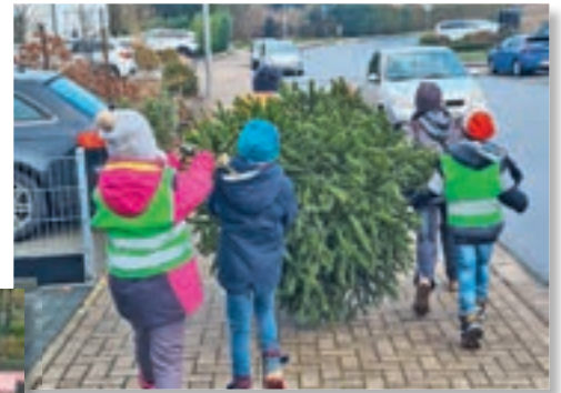
Im Einsatz: Schülerinnen und Schüler der GS Brake bei der Tannenbaum-Sammelaktion im Januar 2022 (oben).

Das Einsammeln sowie Aufladen der Bäume auf die Sammelfahrzeuge und das Klingeln der Kinder an den Haustüren zum Erfragen einer Spende kann dabei zeitlich versetzt stattfinden