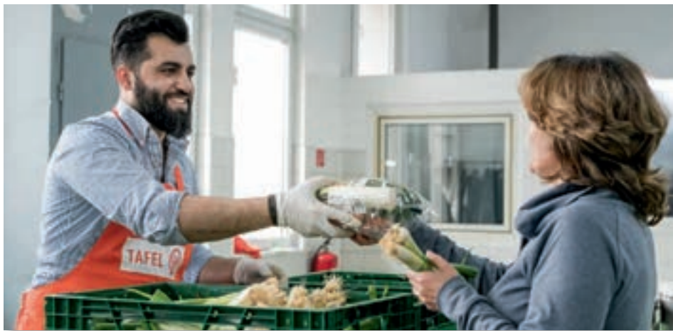
Nur mit vielen helfenden Händen kann die Arbeit der Tafeln gestemmt werden. Ehrenamtliche werden immer gesucht.

Auch in diesem Jahr lädt die Volksbank Bielefeld-Gütersloh alle kleinen und großen Menschen ein, in der Vorweihnachtszeit kreativ zu werden und gleichzeitig Gutes zu tun. Ab sofort gibt es in den Volksbank-Geschäftsstellen Bastelvorlagen (auch als Download), um einen ganz persönlichen Weihnachtsstern zu gestalten. Egal, ob malen, kleben oder modellieren, Hauptsache er ist bunt. Für jedes kleine Kunstwerk, das in der Volksbank wieder abgegeben wird, spendet die heimische Genossenschaftsbank 5 Euro an die Tafeln in der Region und unterstützt damit Hunderte bedürftige Familien mit Kindern.